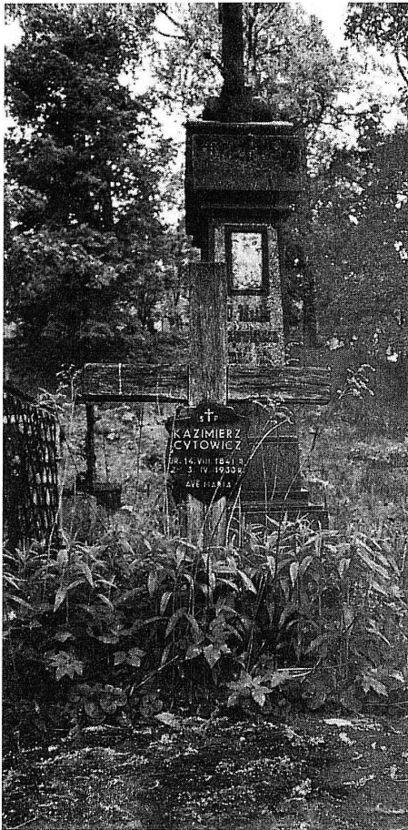
Fotografia 5. Wilno, cmentarz na Roszie, grobowiec Kazimierza Cytowicza (1841–1930), z prawej strony fragment pomnika grobowca żony.