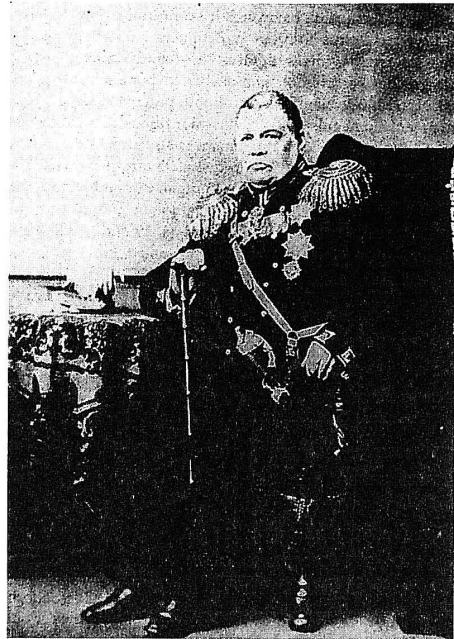
Fotografia 1. Michail N. Murawiew (1796–1866).