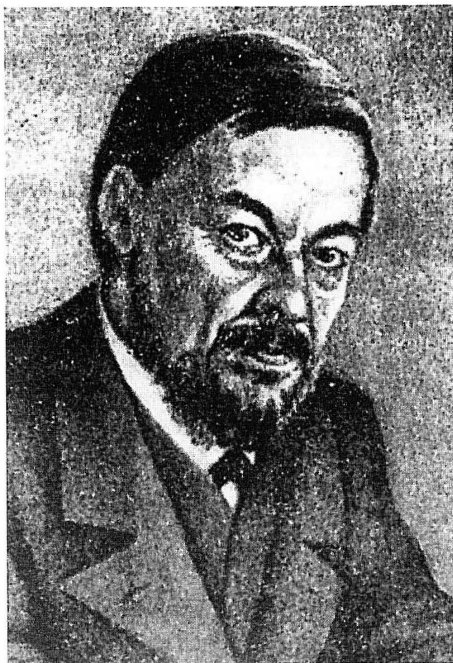
Fotografia 3. Iwan M. Seczenow (1829–1905).